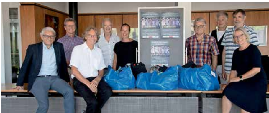
Die Repräsentanten der Organisationen freuen sich über die Spenden des Vereins Musik für den Frieden.