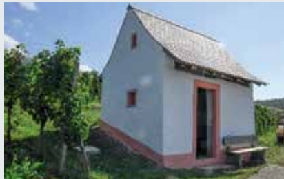
Die beiden Fotos zeigen die Bammerthüsli in Vögisheim und in Gennenbach.

Bedeutung sind. Hinter vielen Geschichten stecken sogar wahre Begebenheiten. Und einige sind auch im Stadtbild präsent wie das Heidemännle und der „Säubaschi“, die als Steinskulptur mitten im Verkehrsstrubel der Werderstraße stehen. Lernen Sie bei einer gemütlichen Wanderung Müllheim von einer anderen Seite kennen. Lassen Sie sich überraschen von alten Sagen neu und frei erzählt von der Erzählerin Karla Krauß als „Magd Marie“.