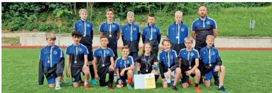
Die D1 Junioren der A08 wurden Meister in ihrer Staffel